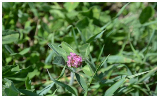
b – Trifolium pratense L