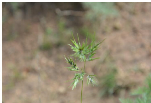
c – Bromus inermis (Leyss.) Holub