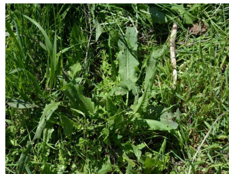
d – Rumex confertus Willd