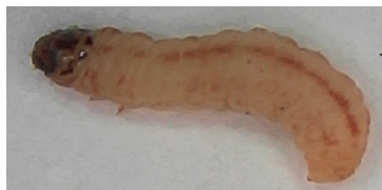
Figure 3 – Casignotella gallivora (Flkv.) ildiri

Saxaul shoots feed on stars in the spring, and saxaul seeds in the autumn. 2 generations per year (table) (figure 3).