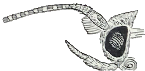
Figure 2 – Coleophora saxauli (Flkv.1972) features of the structure of whiskers and scoops [12, p.89]

Morphological feature. The margins of the front wing of butterflies are 11-12 mm. the Ink is thin, covered, and the outer side is covered with husks. The forewing is white or light grey matting, and has red-brown scales on which the top group is found. The rear wing is Matt white. The brushes of the front and rear wings are light. The ink is thin, the outer side is framed with light brown silk. The 2nd chain is covered with short husks (figure 2) [12, p.47]. The length of the sprockets is 6.5-7.5 mm., the saxaul leaf is a tubular shape made on shoots, the rear valve of the kung is well developed, the color is dark brown.