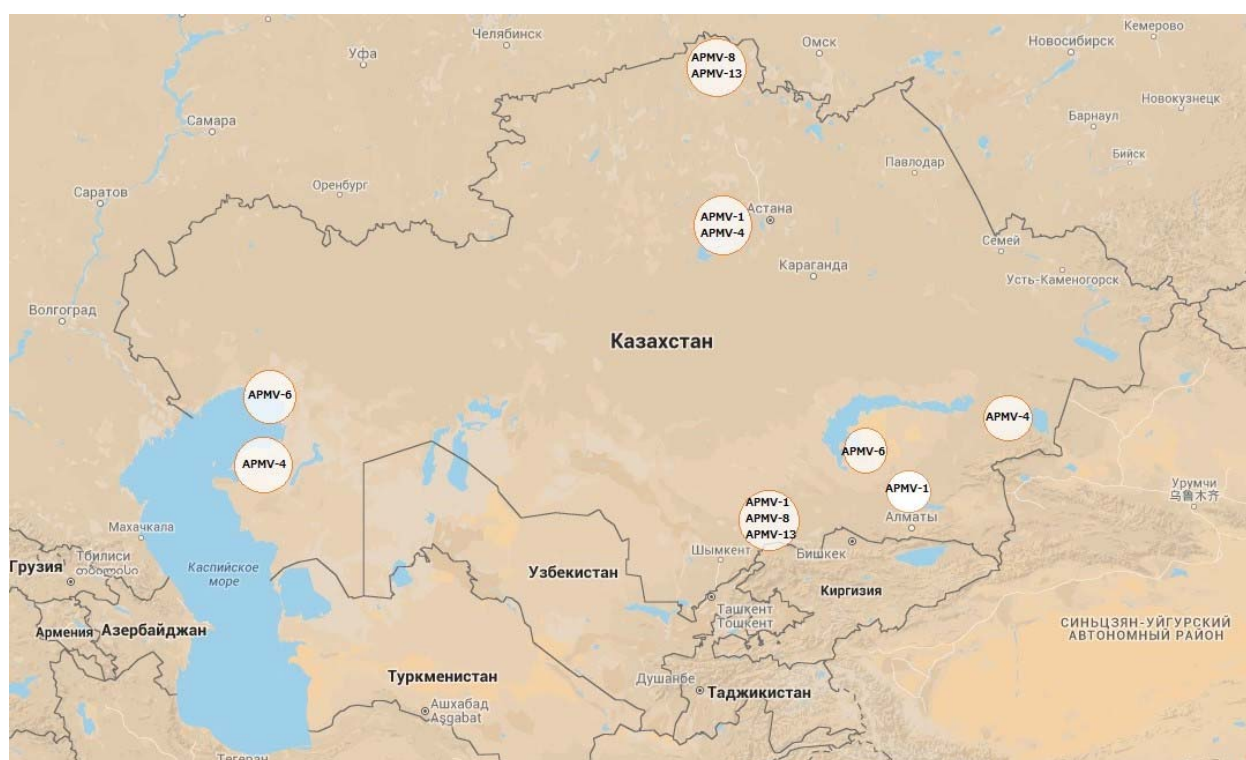
Рисунок 2 – Места обитания диких птиц, инфицированных ПМВ, на территории РК (карта получена на https://maps.google.com )

На рисунке 2 указаны места обитания диких птиц, от которых выделены ПМВ различных серотипов.