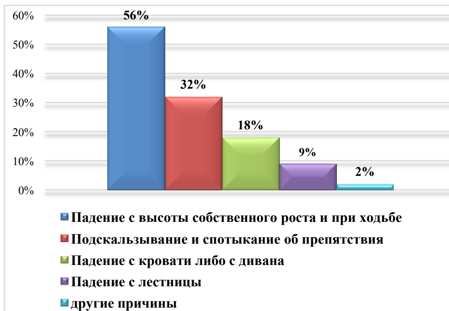
Рисунок 2 – Распределение низкоэнергетических травм по причинам, %

По данным рисунка видно, что причиной более половины (56%) бытовых травм больных послужило падение с высоты собственного роста и при ходьбе; у трети (32%) пациентов перелом произошел в результате подскользывания и спотыкания об препятствия.