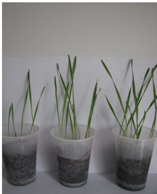
1 2 3

1 - контроль, 2- композиция А, 3 - композиция С