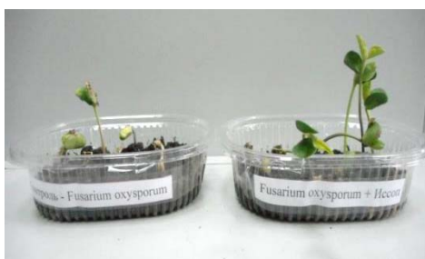
Рисунок 2 – Рост сои на почве зараженной Fusarium oxysporum в контроле и в варианте с обработкой экстрактом иссопа

Примечание. Уровень достоверности p \leq 0,05 .