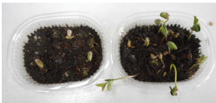
Рисунок 3 – Рост сои в контроле (слева) и в варианте с иссопом (справа) на искусственно созданном инфекционном фоне с Sclerotinia sclerotiorum

Следует отметить, что возбудитель белой гнили сои Sclerotinia sclerotiorum является наиболее агрессивным ее патогеном, поэтому на этом инфекционном фоне рост проростков в контроле был наихудшим (рисунок 3).