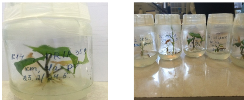
Рисунок 2 – Трансформированные регенеранты батат на селективной среде с канамицином

В ходе экспериментов по трансформации использовались листовые диски, черешки и междоузлия растений полученные в культуре изолированных меристем. Агробактерия содержала генетическую конструкцию DREB1A с 35S промотером. В результате их кокультивирования было получено 12 регенерантов сладкого картофеля, которые были пересажены на селективную питательную среду с канамицином 80 мг/л (рисунок 2). В условиях invitro различий в темпах роста, укоренения, размерах растений исходных и трансформированных линий выявлено не было.