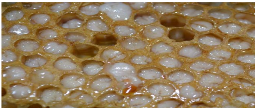
1-сурет – Ұяшықтардағы аталық ара ұрықтарының көрінісі

Аталық ара ұрықтары - бал ара ұясының уақытша тіршілік иелері болып табылады (1-сурет). Олар ерте көктемде өздерінің жалғыз ғана биологиялық міндетін – жас аналық араларын ұрықтандыру үшін пайда болады. Белсенді тіршілік кезеңінде жұмысшы аралар аталық ара ұрықтарын бағып-қағады, бірақ ұяға жемнің келуі тоқтай салысымен, оларды әсел мен жылуға жақындатпай, ұядан қуып, тіршілігін жоюға тырысады [5,6]. Аталық ара ұрықтары аналық арамен қатар тіршілік үшін маңызды - ұрпақ санын көбейту қызметін атқарады [7]. Генетикалық тұрғыда маңыздылығы аналық арадан кем түспейді [8,9,10]. Көптеген ғалымдардың зерттеулері аталық ара ұрықтарының