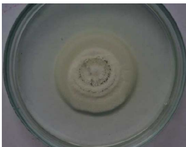
2-сурет – Ascochyta sojicola колониясы