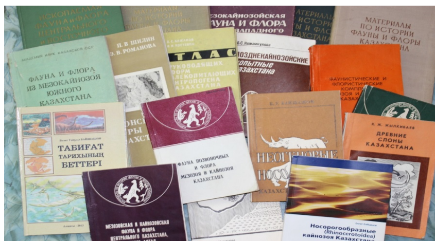
Рисунок 1 – Некоторые печатные продукты лаборатории

Сотрудники лаборатории за 70 лет опубликовали более сотни научных статей и приняли участие во множестве международных конференциях как Казахстана, так и за рубежом, выступая с докладами. Ими издано 12 томов сборника «Материалы по истории фауны и флоры Казахстана» и более 20 монографий (рисунок 1).