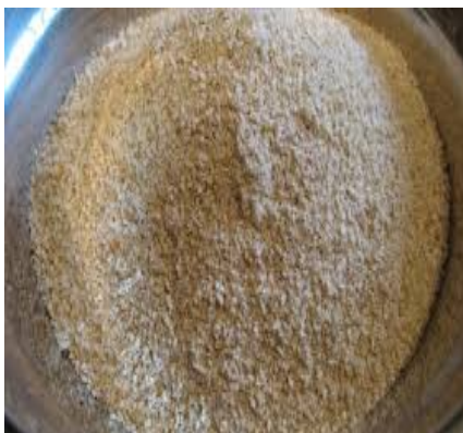
2-сурет – Сұлы жармасы

Сүтті-өсімдік өнімін өндіруде басты технологиялық мәні бұл өсімдік компоненттінің микробиологиялық көрсеткіші. Сұлы жармасының микробиологиялық көрсеткішке сәйкес келетінін СанПиН 2.3.2.1078-2001 талаптарымен зерттелді.