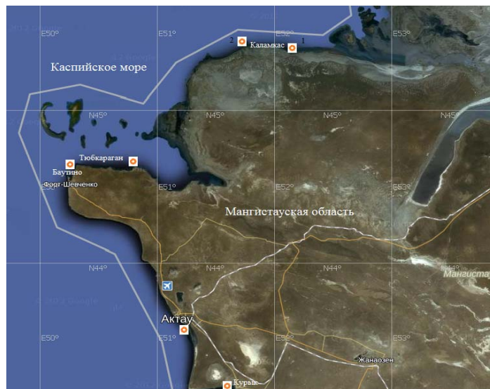
Рисунок 1 – Карта-схема точек отбора проб в прибрежной зоне Каспийского моря на территории Мангистауской области