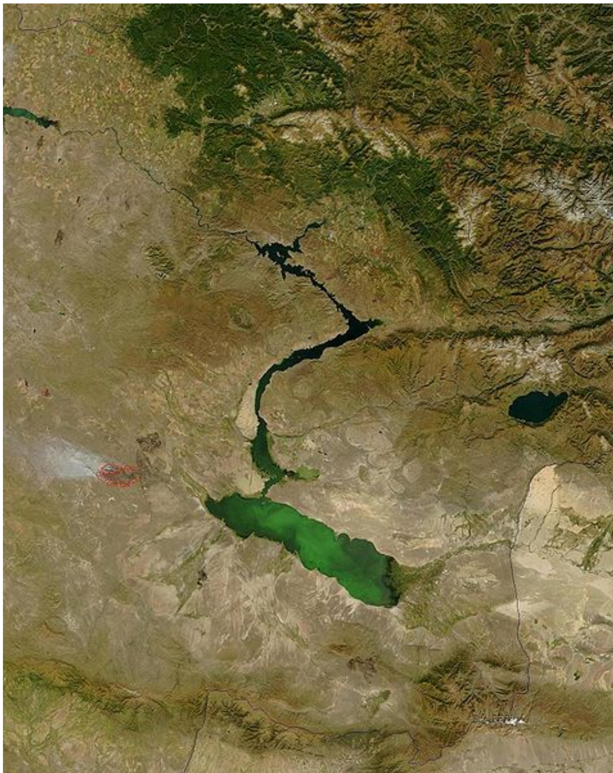
Рисунок 1 – Космический снимок Зайсанской впадины

Зайсанская впадина – самая северная из групп межгорных впадины Средней и Центральной Азии, относится к Джунгарской депрессии и находится в центре Азии, между хребтами Алтай и Тарбагатай, в Восточно-Казахстанской области (рисунки 1, 2).