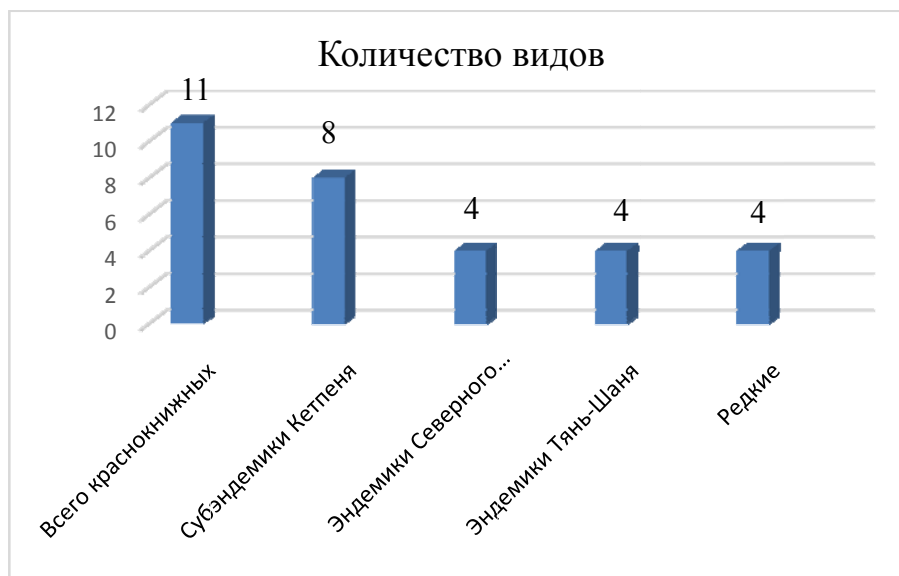
Рисунок 2 – Группы встречаемых растений восточной части хребта Кетпен

По экологическим особенностям все эндемичные и субэндемичные виды можно разделить на три группы: