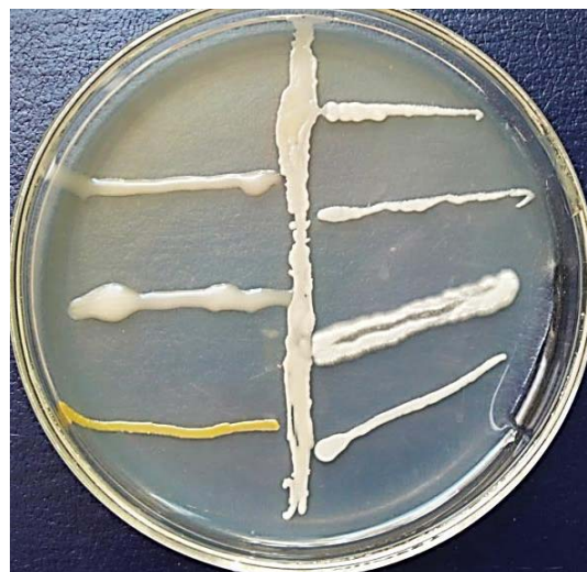
Рисунок 2 – Изучение биосовместимости азотфиксирующих и фосфатмобилизирующих бактерий: 1 - вертикальный штрих - фосфатмобилизирующие бактерии штамм Ф12; горизонтальные штрихи: справа - штаммы фосфатмобилизирующих бактерий; слева - штаммы азотфиксирующих бактерий №6, №22, №14