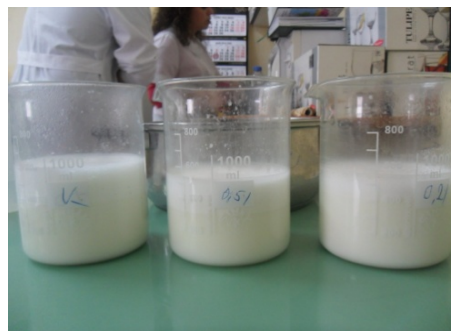
Рисунок 2 – Молочно-жировая эмульсия после гомогенизации

В результате получены однородные молочно-жировые эмульсии и проведены исследования подобранных образцов по определению ее стабильности температурным методом и распределению жировых шариков методом микроскопии. В таблице определены данные стабильности жировой эмульсии для производства ЗЦМ при разных температурах.