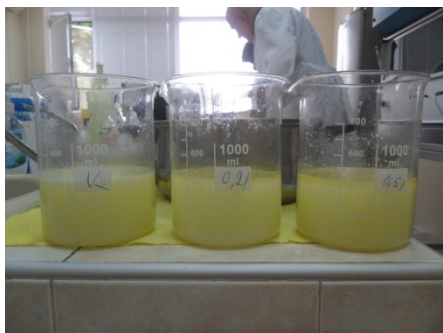
Рисунок 1 – Составление молочно-жировой эмульсии до гомогенизации

Для исследования приготовлены пять образцов молочно-жировой эмульсии с разным процентным содержанием эмульгатора: 1 образец – контрольный, без эмульгатора, 2 образец – с концентрацией эмульгатора 0,1%, 3 образец – с концентрацией эмульгатора 0,2%, 4 образец – с концентрацией эмульгатора 0,3%, 5 образец - с концентрацией эмульгатора 0,5% (рисунок 1). Далее для приведения в однородную консистенцию проведена гомогенизация подготовленных эмульсий (рисунок 2).