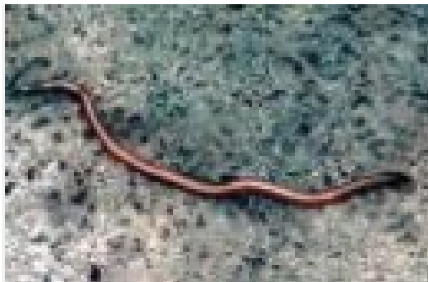
1-сурет – Соқыр жылан Typhlopidae

Қозғалу ерекшеліктеріне байланысты жыландардың омыртқа жотасы біркелкі, көптеген (200-450) омыртқадан тұрады. Омыртқаларында әдетте болатын өсінділерінен басқа жоғарғы доғаның ортасында кішкене өсіндісі болады. Омыртқаның мұндай құрылысы, омыртқа тізбегіне ерекше мықтылық беріп, ирелендеп қозғалғанда, оның тез қозғалуын қамтамасыз етеді.