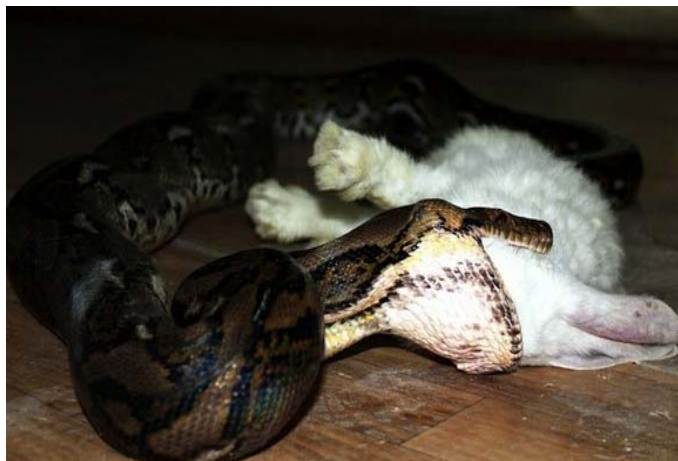
2-сурет – Торлы питонның қоректенуі

мен көлі көп дымқыл ормандарды мекендейді. Әсіресе, ашық жерлерде тіршілік ететіндері, түнде белсенді әрекет етеді. Қалың орманда тіршілік ететіндері күндіз де қорегін аулай береді. Жануарларды өте баяу, сақтықпен, жасырынып келіп, жақын жерден атылып барып ұстайды. Ұстаған жануарының денесіне бірнеше оралып, қысып, тұншықтырып өлтіреді. Бұлардың ішіндегі өте белгілі түрлері: торлы питон ( Python reticulatus ) ұзындығы 5-6 метрден 10 метрге дейін жетеді (2-сурет). Олар Азияның оңтүстігіне және Үнді-Малай архипелагасына тараған. Кәдімгі айдаһар ( Boa constrictor ) ұзындығы 5-6 метрге жетеді. Оңтүстік Американы мекендейді. Бізде Орта Азияда, Кавказда және Қазақстанда бұл тұқымдастықтың ең кіші түрі – дала айдаһары ( Eux jaculus ) кездеседі. Денесінің ұзындығы 1 метрден аспайды. Бұл құмды, шөлдерді, далалы жерлерді мекендейді. Түнде тіршілік етеді. Күндіз кемірушілердің ініне немесе құмға еніп, жасырынып жатады. Ұсақ жорғалаушылармен, саршұнақтармен, қосаяқтармен қоректенеді [3].